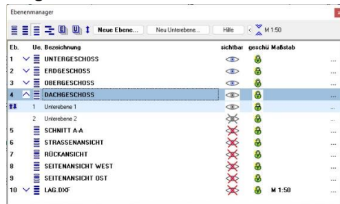
Nur die Unterebenen der Ebene 4 werden angezeigt, alle anderen Unterebenen sind verborgen